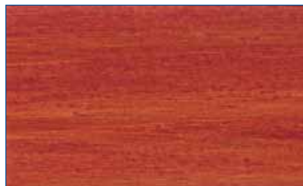
mahagoni RC 565 Art.-Nr. 2255