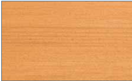
pinie RC 260 Art.-Nr. 2250

Lösemittelhaltige Premium-Holzschutzlasur mit 6-fach-Schutz für außen