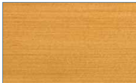
eiche hell RC 365 Art.-Nr. 2264