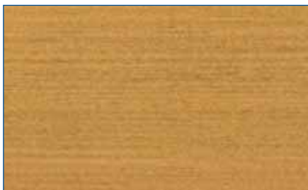
eiche rustikal RC 360 Art.-Nr. 2263