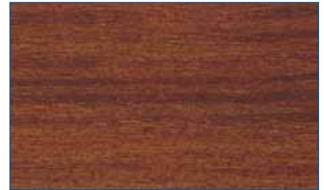
kastanie RC 555 Art.-Nr. 2253