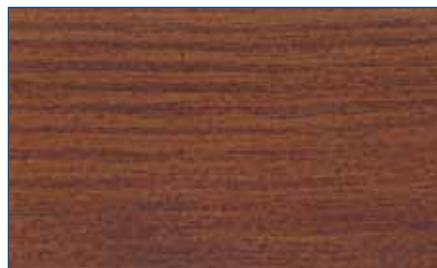
nußbaum RC 660 Art.-Nr. 2260