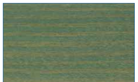
salzgrün RC 965 Art.-Nr. 2292