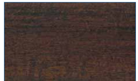
palisander RC 720 Art.-Nr. 2256