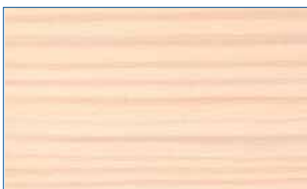
weiß RC 990 Art.-Nr. 2268