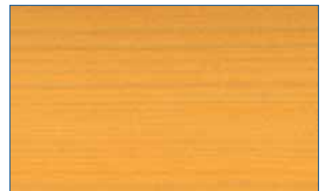
kiefer RC 270 Art.-Nr. 2262