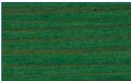
tannengrün RC 960 Art.-Nr. 2254