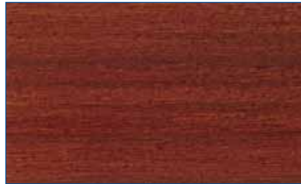
teak RC 545 Art.-Nr. 2251