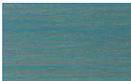
friesenblau RC 950 Art.-Nr. 2269